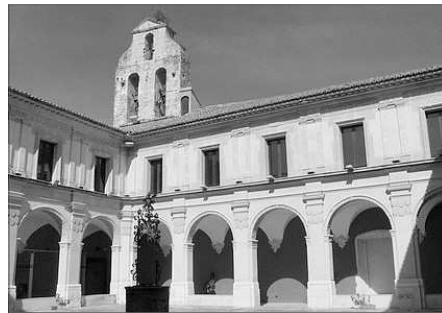
MONASTERI DEL CORPUS CHRISTI. LLUCHENT

En este milacre, i en un altre similar ocorregut en Bolsena , en Italia , es troba l'origen de l'institució de la festivitat del Corpus Christi , de tanta tradició en terres valencianes.