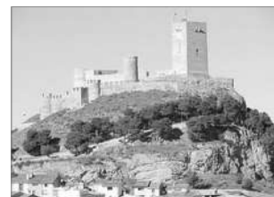
CASTELL DE BIAR