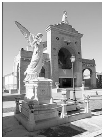
CEMENTERI GENERAL VALENCIA CIUTAT

Es famosa la Fira de Tots Sants de Cocentaina , capital de la comarca de El Comtat , que enguany celebra la 667 edició. Creada per privilegi real en 1346 fon declarada Festa d'Interés Turístic Nacional en 2012. Ferem referència ad ella en el Rogle 62 , de novembre de 2011.