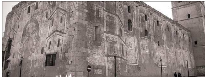
ARQUITECTURES FINGIDES. IGLESIA ARCHIPRESTAL DE L'ASSUNCIO. VINAROS

Tota una ruta monumental i artística que va des de la Prehistòria fins al segle XX. L'itinerari expositiu el formen quatre localitats, cada una de les