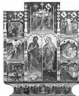
RETAULE DELS SANTS JOANS. MESTRE D'ALBOCASSER

En el Antic Hospital se mostren obres de l'art rupestre llevanti i testimonis dels diferents jaciments arqueològics de El Maestrat , en peces de