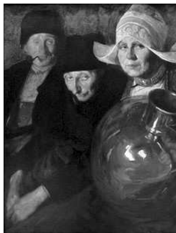
VELLS HOLANDESOS (1909)

La seua obra alcançà altes cotes de popularitat i sobre tot, en la madurea, en la seua faceta com a retratista. Dotat d'una