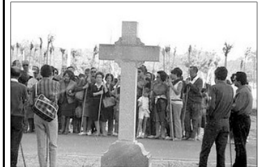
ROMERIA DE LA SANTA FAÇ. PARADA EN EL VIA CRUCIS. 1967

A mitan del recorregut, recuperant una antiga tradició (descansar en la finca Lo de Die , una facenda del segle XVIII), l'Ajuntament instala la coneguda com Paraeta per a fer un paró en el camí i que els romers recuperen les forces prenint rollets d'anís i un got de vi de la Horta d'Alacant (el famós fondello , s.XVI).