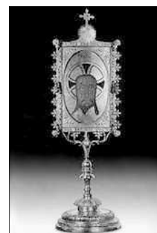
RELICARI DE LA SANTA FAÇ

El recorregut fins al Monasteri de la Santa Faç dura aproximadament dos hores i està marcat per un Via Crucis , construït