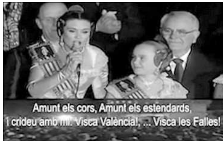
IMAGE DEL VIDEO MENCIONAT EN EL TEXT

Nos remetem a l'editorial que publicàvem fa ara tres anys en el Ro-gle 55 , d'abril de 2011, en el que, referint-nos als cartelllets de la falla de