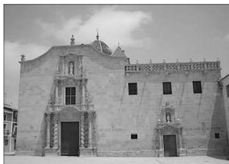
MONASTERI DE LA SANTA FAÇ

En 1636 se redactarien els Estatuts que rigen la guarda i custodia del llenç, aixina com el cult i l'exposició als fidels, que s'establi per al segon dijous despuix de la Semana Santa , dia en que se celebrava una missa i s'exponia la relíquia. En el temps est acte donaria lloc a