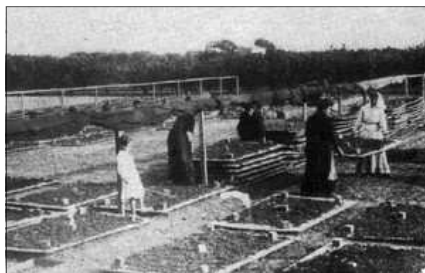
CANYIÇOS EN EL SEQUER

La producció i comerç de la pansa en la comarca de la Marina Alta en el segle XIX originà un important creixement econòmic en esta zona que repercutí en un gran esplendor social. Les localitats de Denia o Xabia foren de les que majorment se veren beneficiades. Les collites dels anys 1850 i 1894 foren excepcionals. Des del port de Denia s'exportava la pansa a nivell mundial. Ya en el segle XV en Anglaterra ad este producte se'l coneixia com a pansa de Denia . Este