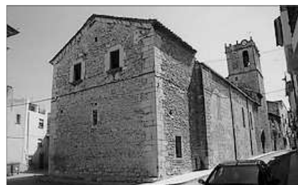
IGLESIA DE NOSTRA SENYORA DE L'ASSUNCIO

A l'exposició se dediquen dos edificis monumentals, testimonis de l'esplendor de Cati com a lloc privilegiat en les rutes comercials de les èpoques migeval i moderna entre les poblacions de l'interior i els ports de la costa, aixina com a lloc de pas de la Via Jacobea i la Via Vicentina . El primer d'ells, la Casa Llonja de la Vila , constitueix una joia del gòtic civil mediterraneu, un dels millors eixemples conservats i documentats de construcció de consistoris valencians. Est edifici se dedica als tallers didàctics de l'exposició. Prova de l'important paper que jugà l'Ajuntament de Cati com a lloc destinat a albergar les reunions del Consell es la seua planta noble, una gran sala gòtica en sol empedrat, sostre treginat i magnífiques columnes, en pintures murals que mostren imatges navals, representació del comerç marítim.