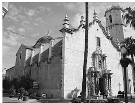
IGLESIA DE SANT BERTOMEU

La localitat fon testic en el segle XVI d'un auge econòmic, artístic, comercial i cultural, favorit, econòmicament, per la seua condició de via comercial i de comunicació i, políticament, pel posicionament que mantenien a favor de la corona regnant. El Convent de Sant Francesc i la Iglesia de Sant Bertomeu son manifestacions d'este esplendor.