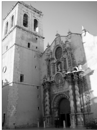
IGLESIA DE NOSTRA SENYORA DE L'ASSUNCIO

Pulchra Magistri , de La Llum de les Imagens , te com a colofó d'este repàs a "L'Esplendor d'El Maestrat" la visita a Vinaros , seu en la que se recorre " De l'Edat Moderna a la Contemporània ", recordant l'importància que tingue la població des de finals del segle XVII al XX. Paper fonamental en el desenvolupament vinarossenc ha segut el port, testimoni de lo qual es l'imponent