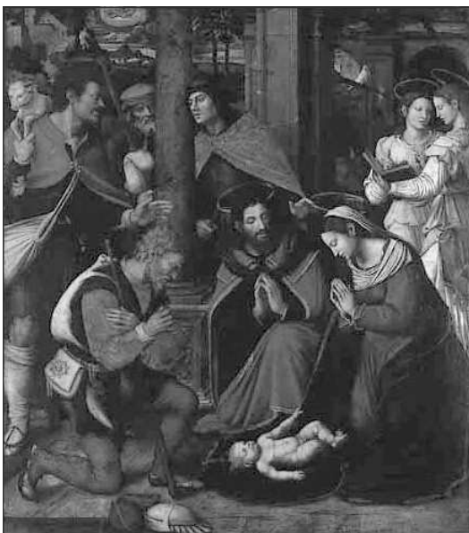
L'ADORACIO DELS PASTORS, VICENT MACIP. MUSEU DE LA CATEDRAL DE SOGORP

El "aguinaldo", "arguinaldo", "aguirlando"... es un cant en el que els mes menuts i jovens s'acompanyaven per a solicitar presents -les estrenes o aguinaldo -, recorrent les cases de porta en porta durant les festes nadalenques. Musicalment se'n troben de dos classes diferenciats i definits, segons deriven de les albadas , en la seua versio en llengua castellana, o de les albadas , en llengua valenciana, que, si be en general es poden pareixer, les primeres son de ritme alegre i rapit i les segones un tant mes reposades; les primeres en veu d'un cantor, les segones en veu de dos cantors que s'alternen en el cant. Inclús es pot trobar una tercera variant, sorgida de la cobla principal o tornada de les cançons de nadal, o inclús en algun altre cas s'extrapolen a temes (melodies) populars preexistents.