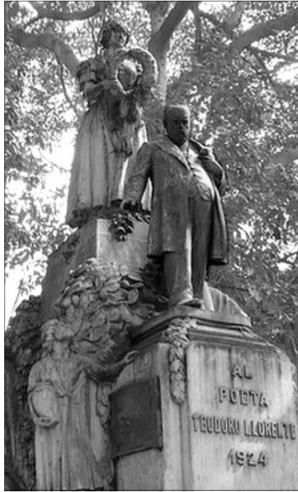
MONUMENT A TEODOR LLORENTE EN VALENCIA C.

Llorente es un home polifacètic, una personalitat en un pes molt important en aquella societat valenciana que acabava una centúria i iniciava el seu caminar en un segle XX que augurava certes esperances per al valencianisme, inclús polític, pero que es veren frustrades pel conflicte bèlic de 1936. Llorente fon periodista; inicià esta faceta en el diari La Opinión , que havia fundat el Marqués de Campo, pero, abandonat aquell projecte, pronte fundà i serà director de Las Provincias -diari que concep com a regional i que serà la veu del conservadurisme, havent de competir en el republicà El Pueblo de Blasco Ibáñez-; es historiador, almenys fa incursions en l'investigació històrica, i nos deixà la seua magna obra Valencia. Sus monumentos y artes, su naturaleza e historia