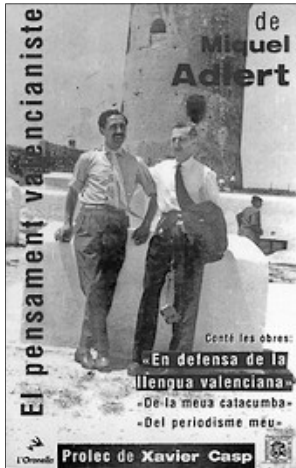
PORTADA D'UNA REEDICIÓ DE TRES OBRES D'ADLERT

Hi ha personalitats que creixen en el temps com el millor oli verge, noms que s'han convertit en Referents indefugibles per a entendre un fum de qüestions identitàries que mai aplegaríem a aclarir sense la seua aportació.