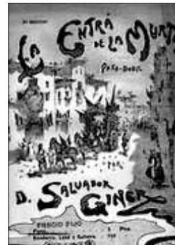
PORTADA DE LA PARTITURA DE L'ENTRÀ DE LA MURTA