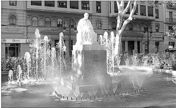
MONUMENT A SALVADOR GINER EN VALENCIA C.