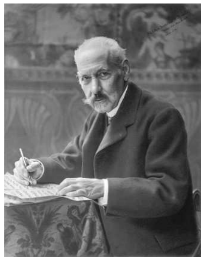
SALVADOR GINER I VIDAL (1832-1911)

Teodor Llorente i Salvador Giner compartixen, ademes del beneplacit de l'autoritat, la circums-