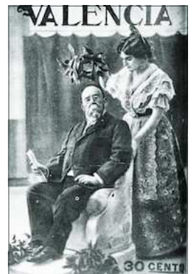
FIGURACIO DE LA CORONACIO DE TEODOR LLORENTE