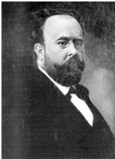
TEODOR LLORENTE I OLIVARES (1836-1911)

Recorrem en esta ocasio a la publicacio d'un numero Extra de Rogle com a formula per a resumir en una lo que consideravem tres obligacions. El simbolisme que entranya la celebracio de qualsevol centenari nos ha oferit l'ocasio de