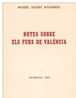
Notes sobre els furs de València, 1980