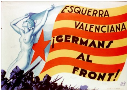
Germans al front (Cartell)