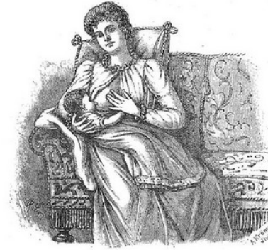
Fig. 10.—Posició normal durante la lactància (según la Doctora Anna Fischer)

En 1905 defen la seua tesi doctoral "El cordo umbilical", obtenint el doctorat en qualificacions d'excel·lència. Gràcies a la seua labor científica i social finalment