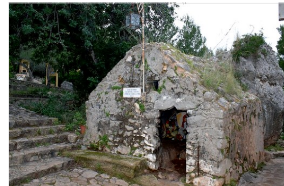
Caseta del pare Pere

A la nit següent va ser tret el cos del venerable de la fossa comuna dels religiosos i, tancat en una arca de fusta, va ser depositat en la caseta de la paret de la capella de sant Lluís Bisbe, a on va permanéixer fins al 20 de febrer de 1839, quan, exclaustrats els religiosos i ocupat el convent com a quarter, uns soldats varen descobrir la caseta, i en ella l'arca.