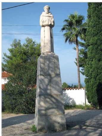
Estàtua del pare Pere instal·lada en 1959 enfront de l'ermita.

En aplegar la notícia a Dénia, varen ser comissionats immediatament dos delegats per a que es presentaren en València i reclamaren el dret de Dénia a posseir les despulles del venerable Pare, cosa que va ser concedida en l'acte.